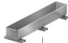
Insert pour revêtement de surface au choix Art.N° 100617