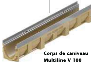
Corps de caniveau 100 cm Multiline V 100