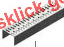
Grille à fente Art.N° 100620