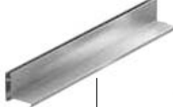
Élément de rehausse excentrique 50 cm