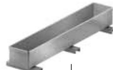
Insert pour revêtement de surface au choix Art.N° 100637