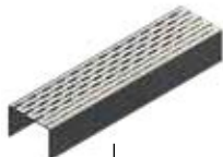
Grille à fente longitudinale Art.N° 100639