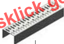
Grille à fente Art.N° 100640