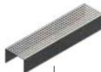
Grille perforée Art.N° 100638