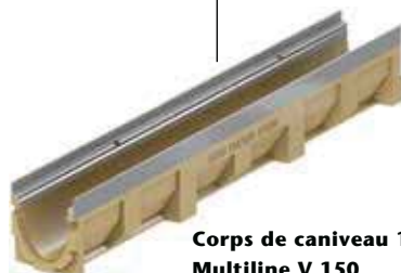
Corps de caniveau 100 cm Multiline V 150