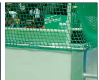
Stangensystem zur Netzbefestigung.