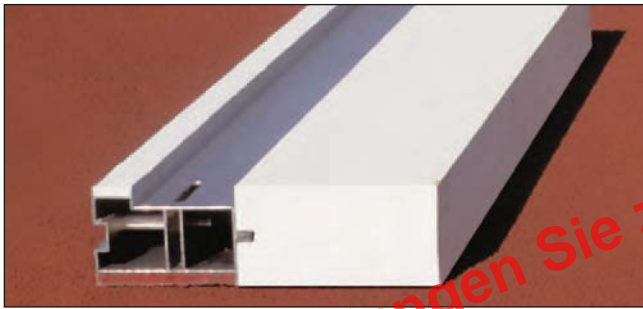
ZWEI IN EINEM „Massivholz“, Art.Nr.: S01000118