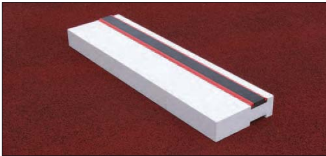
Absprungbalken aus Vollkunststoff, Art.Nr.: S01001202