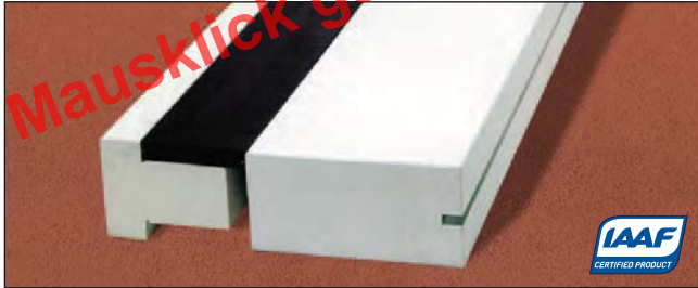
Absprungbalken mit IAAF-Zertifikat, Art.Nr.: S01000117