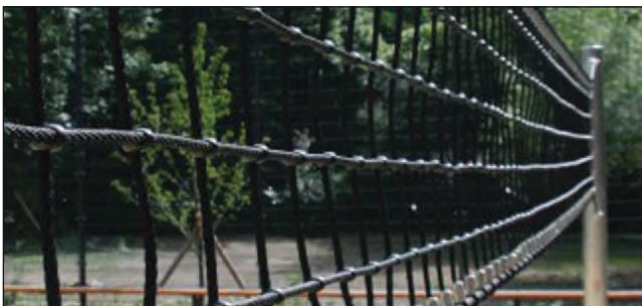
Volleyballnetz, Art.Nr.: S10002220