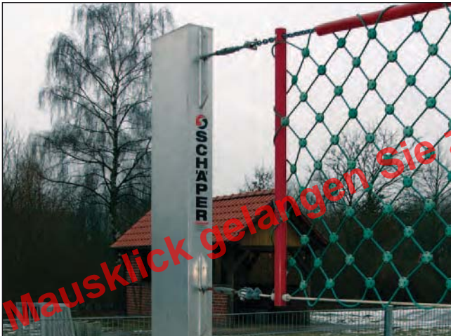
Volleyballpfosten „Herkules“, Art.Nr.: S10000200