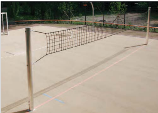
Volleyballpfosten „Herkules II“, Art.Nr.: S10002200