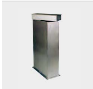
Bodenhülse, Art.Nr.: S00003091