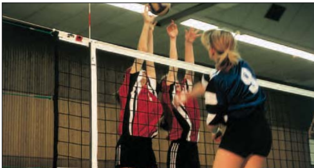
Volleyball-Turniernetz, Art.Nr.: A99000147