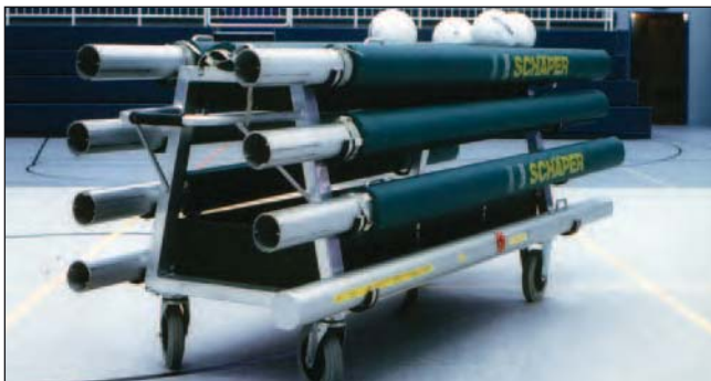
Fahrbarer Ablagegeständer für Volleyball-Pfosten, Art.Nr.: S10BA2010