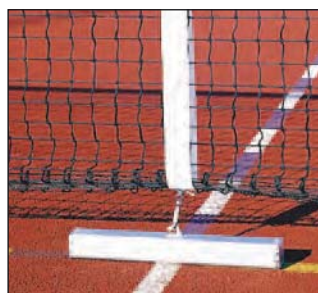
Regulierband, Art.Nr.: S11001582