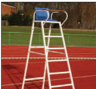
Schiedsrichterstuhl, Art.Nr.: S11AS0152