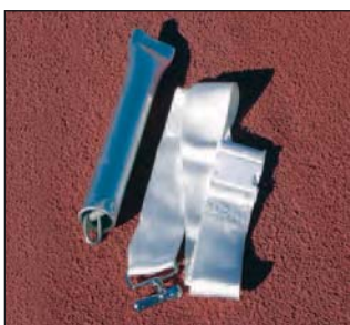
Regulierband, Art.Nr.: S11001581