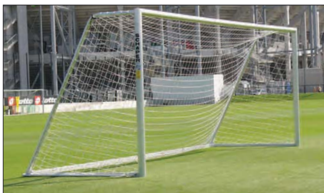
Trainings- und Jugendfussballtor