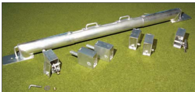
Ankerbalken aus Aluminium