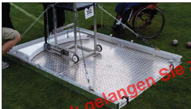
Werferplatte aus Aluminium