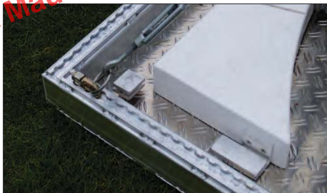
Werferplatte aus Aluminium