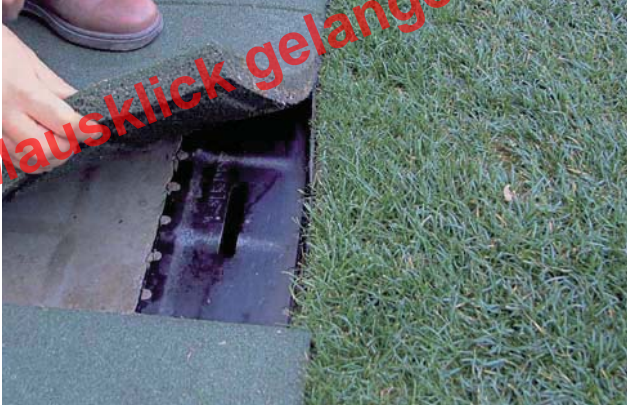
SPORTFIX Schlitzrinne im Estádio da Luz