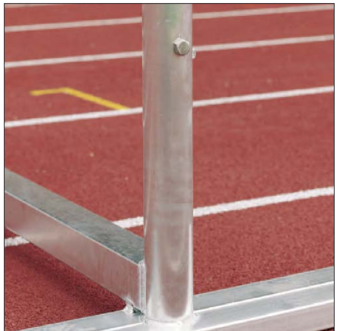
Mit zusätzlichem unterem Querrohr

3 x 3.96 m + 1 x 5.00 m Länge: Art.Nr.: S03WK1037