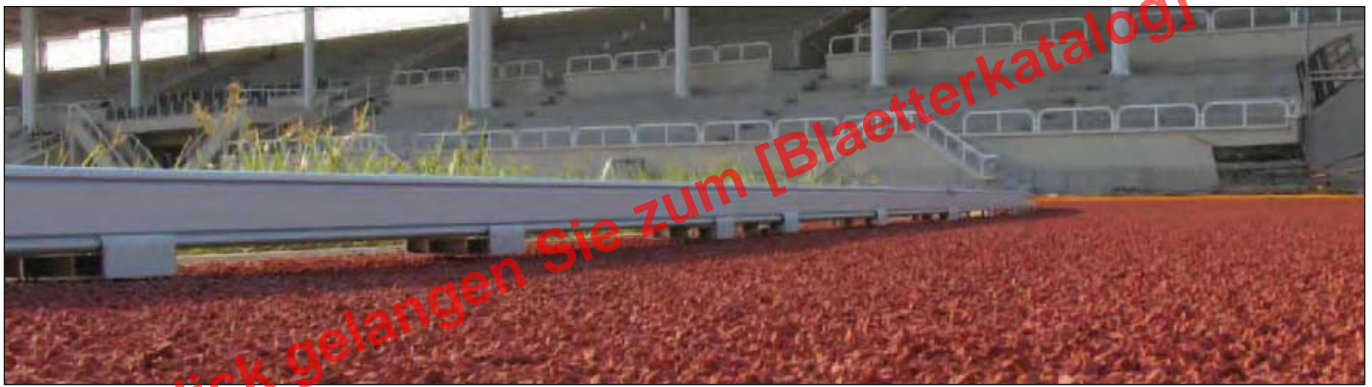
Laufbahnbegrenzung (Zarge), komplett aus Aluminium gefertigt, mit IAAF-Zertifikat