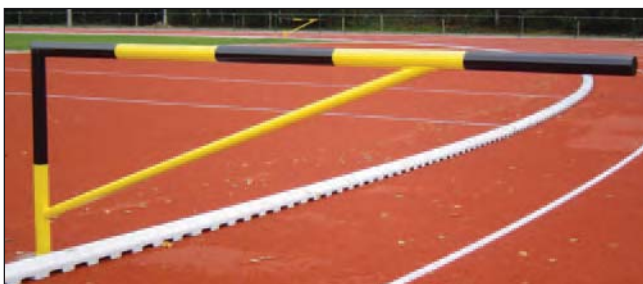
Laufbahnabspernung, Art.Nr.: S0300AB01

Bodenhülse aus Stahl mit Absperrovrrichtung und Schloss.