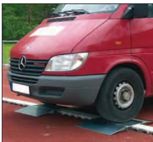
Überfahrrampe, Art.Nr.: S0300R410

Gerne passen wir unsere Laufbahnbegrenzung und Barrieren den örtlichen Gegebenheiten Ihrer Laufbahn an. Nutzen Sie unsere langjährige Erfahrung und sprechen Sie uns an!