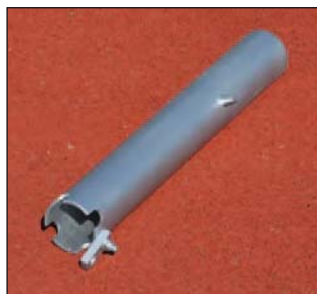
Bodenhülse, Art.Nr.: S03ST2002