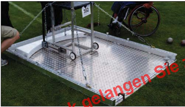
Werferplatte aus Aluminium