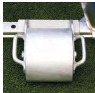
Einzelgewichte, Art.Nr.: S00000071