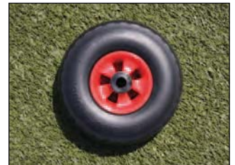
Auf Wunsch ausgeschäumte Lufträder. Art.Nr.: S00RV0084