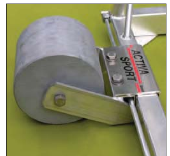
Fahrrollen, Art.Nr.: S00000080

4 Einzelgewichte von je 40 kg: Art.Nr.: S00000071 zum Auflegen auf das Tor (feuerverzinkt), 4 Stück.