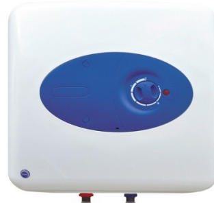
15 und 30 Liter Druck oder druckloser Betrieb