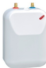
5 Liter Nur drucklos