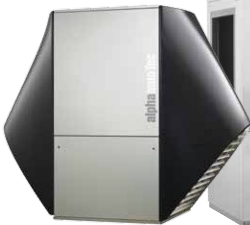
LW 90 Solar