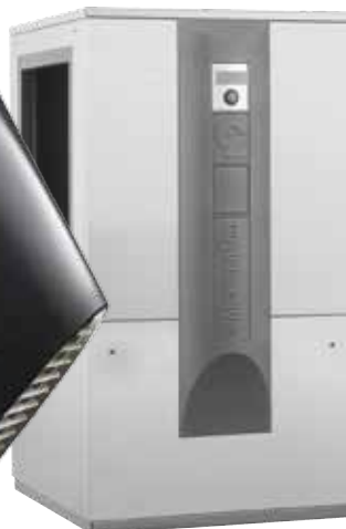
LW 90 Solar