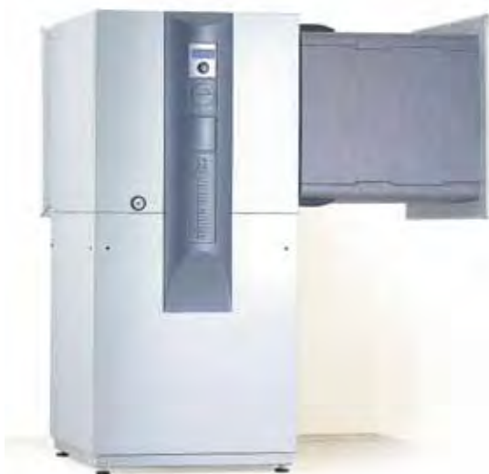
Pompe à chaleur Air/Eau avec système de conduit d'air LKS

Système de conduit d'air LKS – comme un jeu de construction.