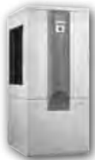
LW 140 LW 180 LW 180H