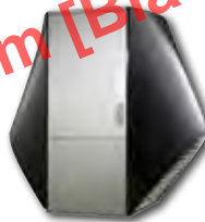
LW 140A LW 140A/RX LW 180A LW 180H-A