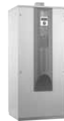
WWC 280 - WWC 440X