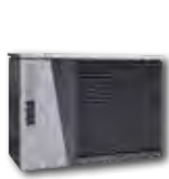
LWD 50A - 70A