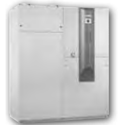
KHZ-LW 60 KHZ-LW 80