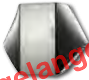
LW 90A/RX LW 101A LW 100H-A