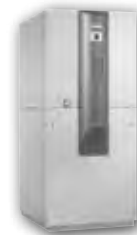
LWC 60 - 120