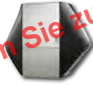
LW 90A Solar LW 121A