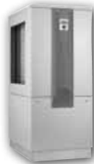
LW 251 LW 310