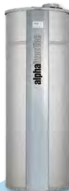
BWP 306 S