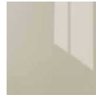
523 Champagner-metallic Champagne-metallic