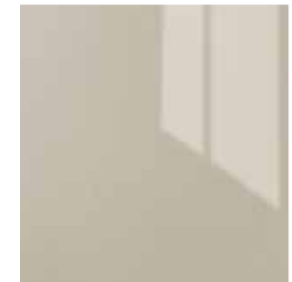
523 Champagner-metallic Champagne-metallic