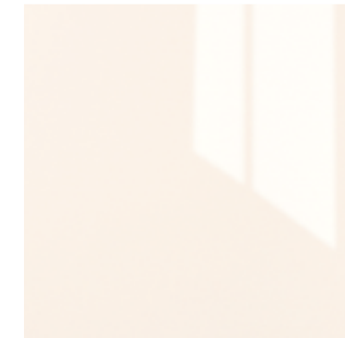
521 Magnolienweiß Magnolia white