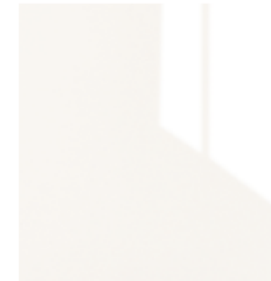
518 Weiß White