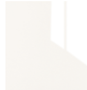
518 Weiß White