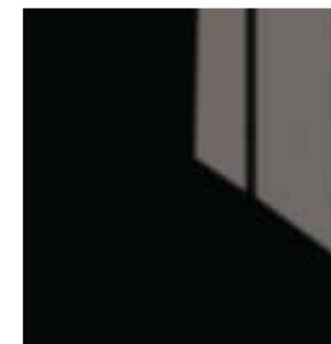
519 Schwarz Black