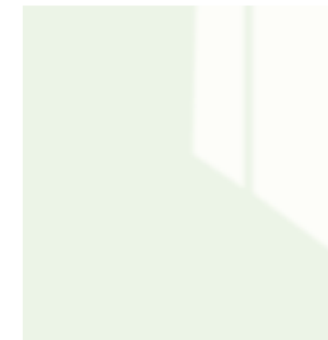
524 Glasgrün Bottle green