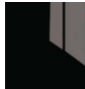
519 Schwarz Black