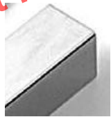
Chrom glänzend Edelstahl Poliert

Alle Oberflächen eignen sich für die Verwendung im Badezimmer, sind robust und einfach zu reinigen. Swiss - Line ist in jeder Hinsicht dauerhafte Qualität, so dass wir eine Garantie von 5 Jahren auf Fabrikationsfehler gewähren.