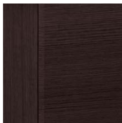
Coffee / Coffee