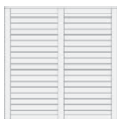
Rückseite SUNLINE Sichtblende

SUNLINE Einzeltor: maximale Breite 125 cm, maximale Höhe ca. 200 cm – Doppeltor: maximale Breite 250 cm, maximale Höhe ca. 200 cm. Bei einer Bestellung ist die DIN Richtung erforderlich. Technische Hinweise siehe Seite 115. Passende Pfosten finden Sie auf der Seite 154.