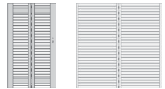
Rückseite Einzeltor Italia Rückseite Sichtblende Italia