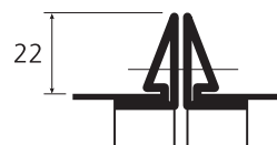
Profilrahmen OPR22 Cadres profilées OPR22