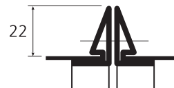
Profilrahmen OPR22 Cadres profilées OPR22